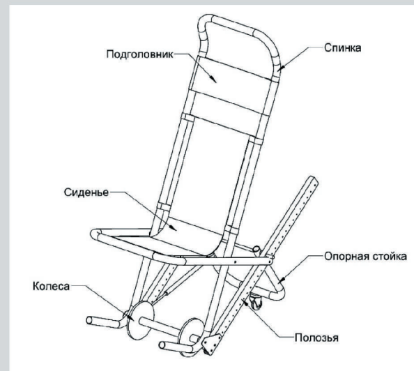
общий вид устройства и его составные элементы